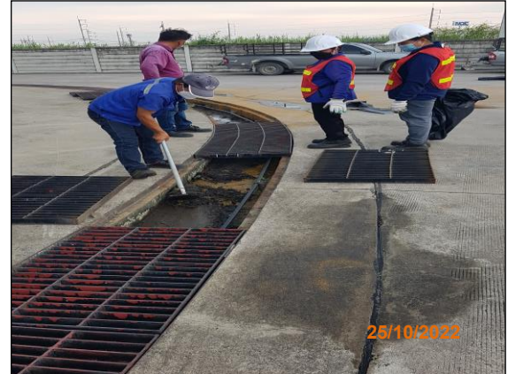
ภาพที่ 2.2-5 การทำความสะอาดรางระบายน้ำ บริเวณพื้นที่ก่อสร้าง