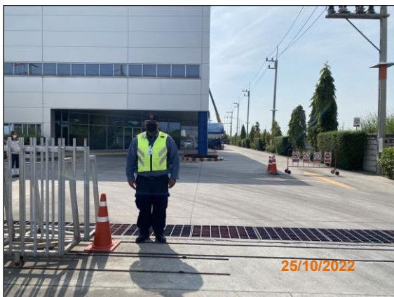
ภาพที่ 2.2-6 เจ้าหน้าที่รักษาความปลอดภัย และดูแลอำนวยความสะดวกการจราจร