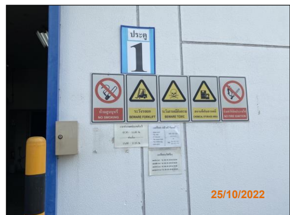
ภายในพื้นที่โครงการ