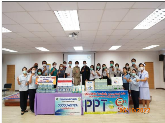
สนับสนุนน้ำดื่มจำนวน 100 แพค แก่โรงพยาบาลพานทอง