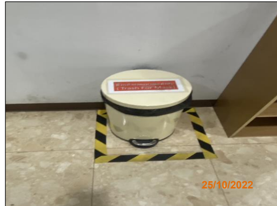
ภาพที่ 2.2-18 ถังขยะแยกประเภท