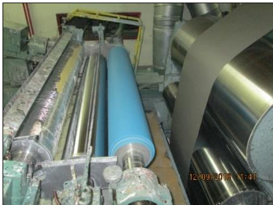
เครื่องเคลือบสีด้วยลูกกลิ้ง (เคลือบด้านหน้า)