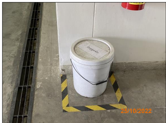
ภาพที่ 2.2-35 วัสดุดูดซับสารเคมี