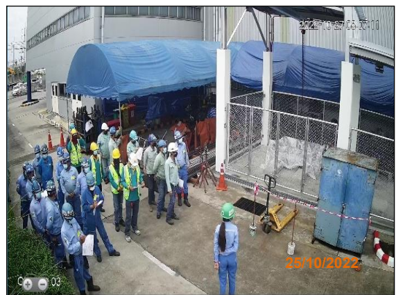
ภาพที่ 2.2-11 การฝึกอบรมด้านอาชีวอนามัย และความปลอดภัยแก่คนงาน