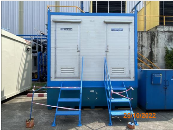
ภาพที่ 2.2-4 ห้องสุขาชั่วคราว