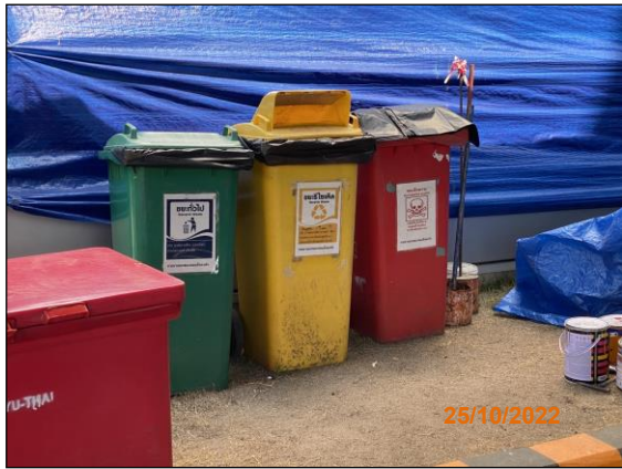
ภาพที่ 2.2-2 ถังขยะแยกประเภท บริเวณพื้นที่ก่อสร้าง