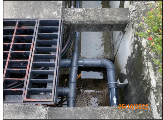
ระบบท่อน้ำเสีย