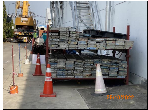
ภาพที่ 2.2-8 ขอบเขตบริเวณพื้นที่ก่อสร้าง