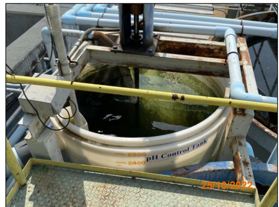
ระบบบำบัดน้ำเสียปนเปื้อนสารละลายกรด