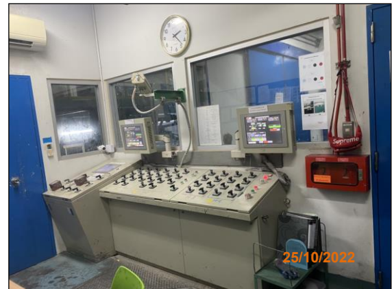
ภาพที่ 2.2-21 Control Room