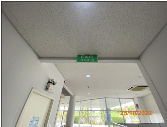
ภาพที่ 2.2-32 ป้ายทางหนีไฟ