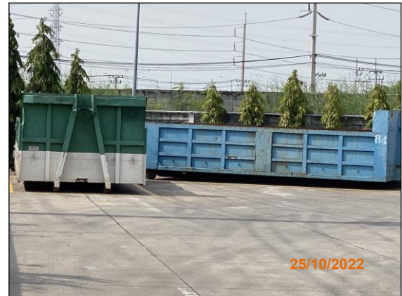
ภาพที่ 2.2-19 พื้นที่รวบรวมกากของเสีย