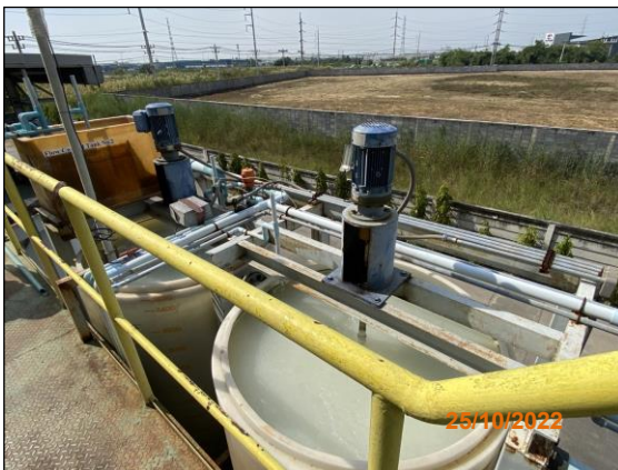
ระบบบำบัดน้ำเสียปนเปื้อนโครเมียม