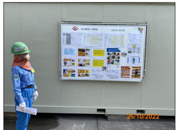
ภาพที่ 2.2-9 ป้ายเตือนและบอร์ดประชาสัมพันธ์ด้านความปลอดภัยบริเวณพื้นที่ก่อสร้าง