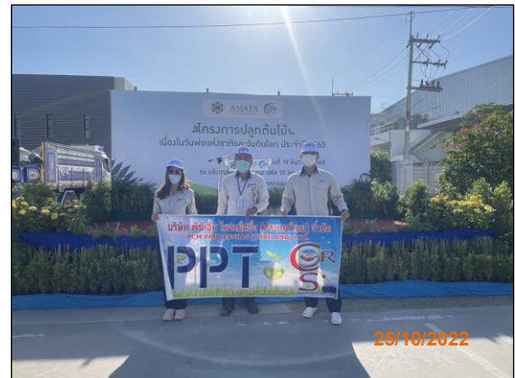
กิจกรรมปลูกต้นไม้วันพ่อแห่งชาติและวันดินโลก ร่วมกับทางนิคมอุตสาหกรรมอมตะซิตี้ ชลบุรี