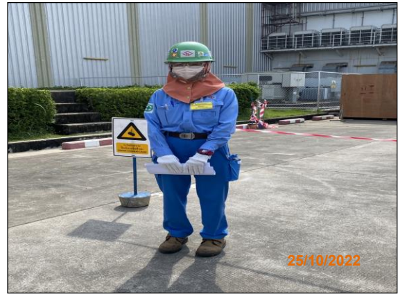
ภาพที่ 2.2-3 อุปกรณ์ป้องกันอันตรายส่วนบุคคล บริเวณพื้นที่ก่อสร้าง