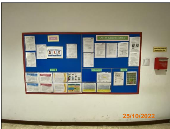
ภาพที่ 2.2-22 บอร์ดประชาสัมพันธ์