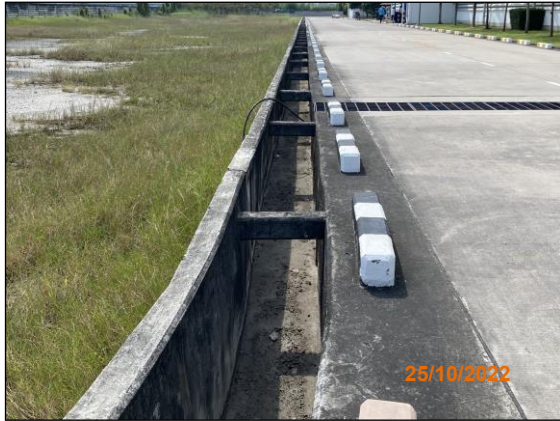
รางระบายน้ำฝน