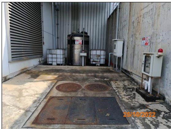
ภาพที่ 2.2-34 บริเวณถังเก็บกรดซัลฟูริก