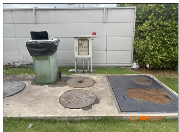
ภาพที่ 2.2-15 ระบบบำบัดน้ำเสียสำเร็จรูป