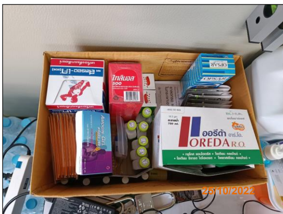
ภาพที่ 2.2-10 อุปกรณ์ปฐมพยาบาล