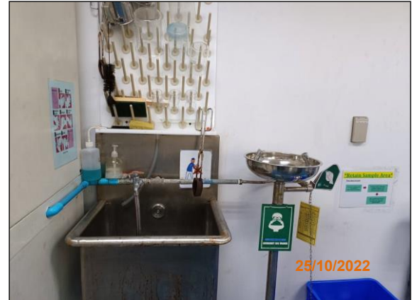
ภาพที่ 2.2-28 ฝักบัวล้างตัว และอ่างล้างตาฉุกเฉิน