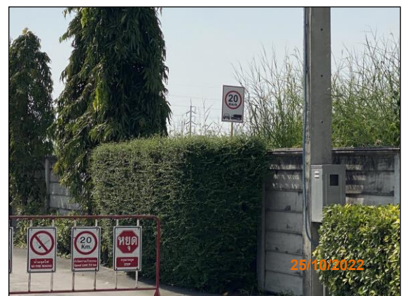
ภาพที่ 2.2-7 ป้ายจำกัดความเร็ว