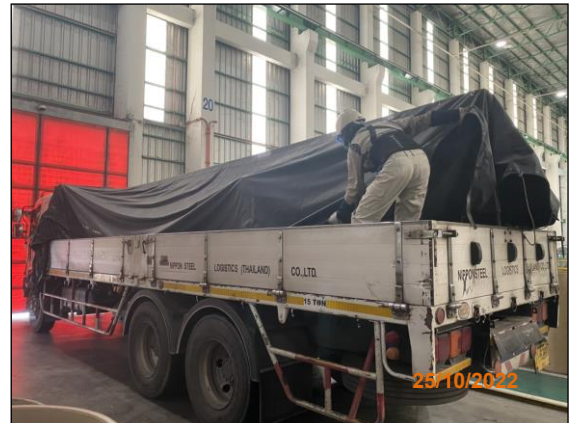
ภาพที่ 2.2-23 การคลุมผ้าใบรถบรรทุก