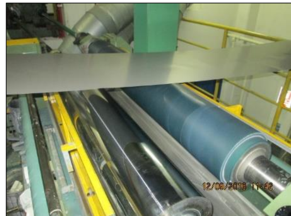
เครื่องเคลือบสีด้วยลูกกลิ้ง (เคลือบด้านหลัง)