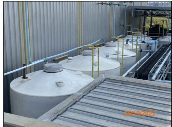
ภาพที่ 2.2-13 ถังรองรับน้ำเสีย