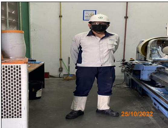
ภาพที่ 2.2-20 พนักงานสวมใส่ PPE