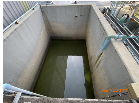
บ่อพักน้ำทิ้งขนาด 111 ลูกบาศก์เมตร