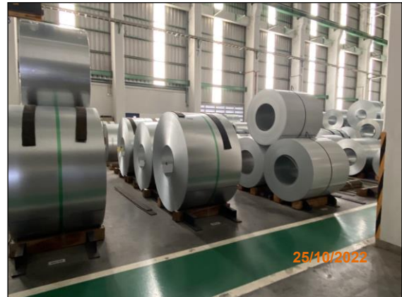
ภาพที่ 2.2-30 พื้นที่เก็บวัตถุดิบและผลิตภัณฑ์