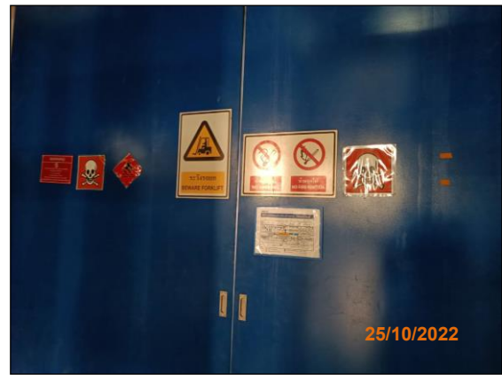
ภาพที่ 2.2-33 ห้องเก็บสารเคมีและป้ายเตือนอันตราย