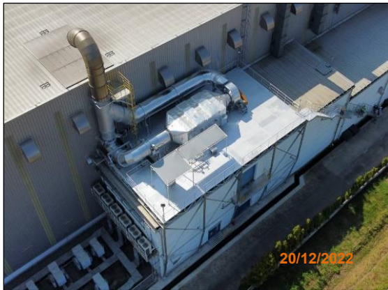
ภาพที่ 2.2-12 ระบบบำบัดอากาศแบบ Selective Catalytic Reduction (SCR)