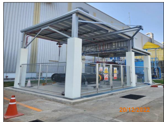
บริเวณดังกล่าวเก็บแอมโมเนีย