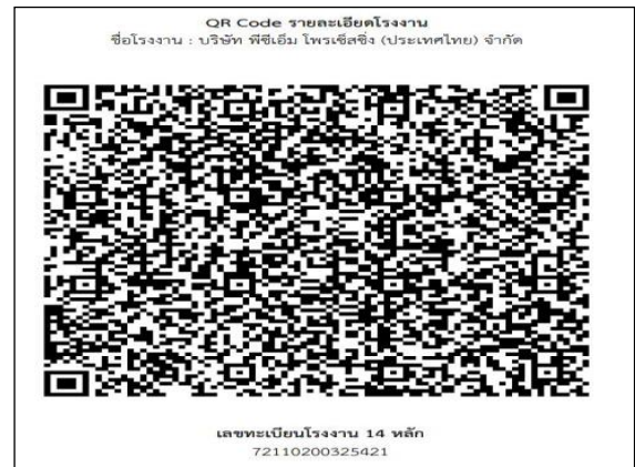
ภาพที่ 2.2-25 ช่องทางการรับเรื่องร้องเรียน (QR CODE) ที่บริเวณด้านหน้าโครงการ