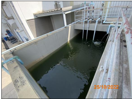
บ่อพักน้ำทิ้งขนาด 107 ลูกบาศก์เมตร