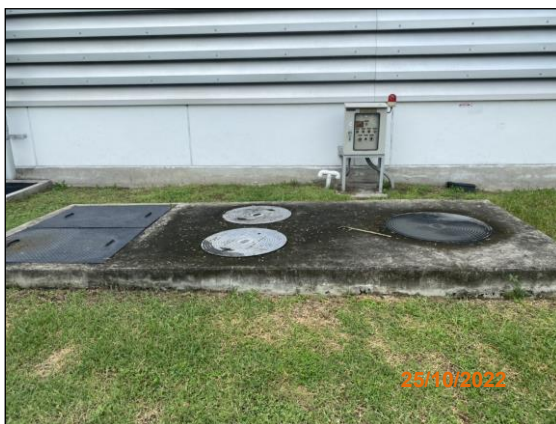
ภาพที่ 2.2-14 ระบบบำบัดน้ำเสียทางเคมี